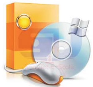
Phần mềm quản lý