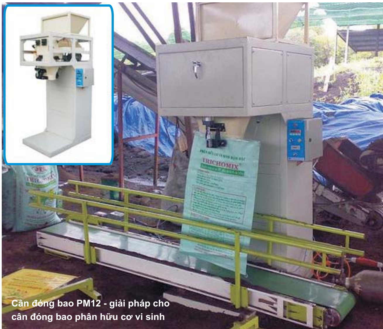
Cân đóng bao PM12 - giải pháp cho cân đóng bao phân hữu cơ vi sinh